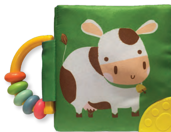
VACA - ISBN: 9789463993449