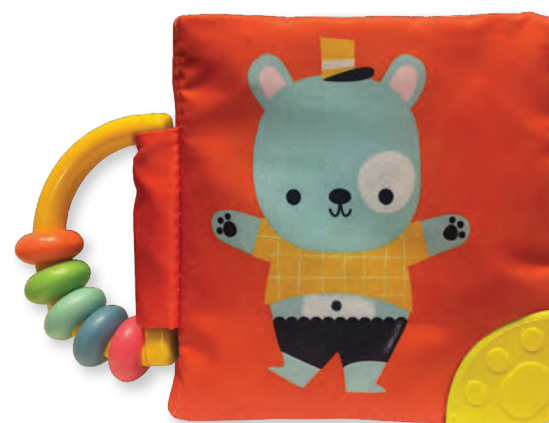
OSO - ISBN: 9789463993456

Con este libro suave tu bebé se divertirá durante un largo rato. Las coloridas ilustraciones, el sonajero, el mordillo y las páginas que crujen, fascinarán a tu bebé y estimularán el desarrollo de sus sentidos. El libro viene en una práctica bolsa de plástico, muy fácil de llevar ¡para divertirse en casa y cuando estén de paseo!