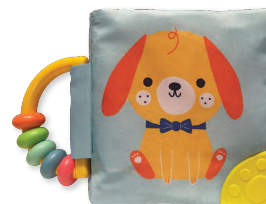
PERRO - ISBN: 9789463993432