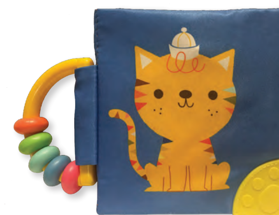
GATO - ISBN: 9789463993425